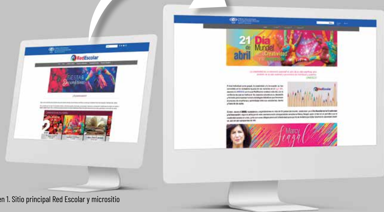
Imagen 1. Sitio principal Red Escolar y microsito

Eso no impide que puedan ser complejos; aunque, por norma general, no suelen serlo. Sin embargo, estarán en la posibilidad de ofrecer información selecta sobre algún tema o información concreta; además, de promover experiencias atractivas, dinámicas e interactivas que garanticen un mayor impacto y por tanto su uso académico entre los usuarios.