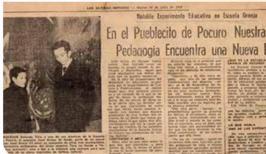
Imagen 3. Recorte de periódico de 1953

Continúa comentando en un artículo para el periódico Las últimas noticias , fechado el 14 de julio de 1953: