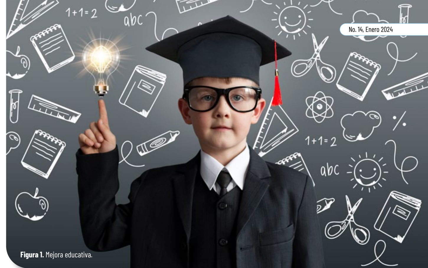
Figura 1. Mejora educativa.

Este cambio radical, en la manera de hacer política educativa, implicó dejar atrás un Sistema Nacional de Evaluación Educativa (SNEE) centrado en la calidad y coordinado por el Instituto Nacional para la Evaluación de la Educación (INEE) cuyo ob-