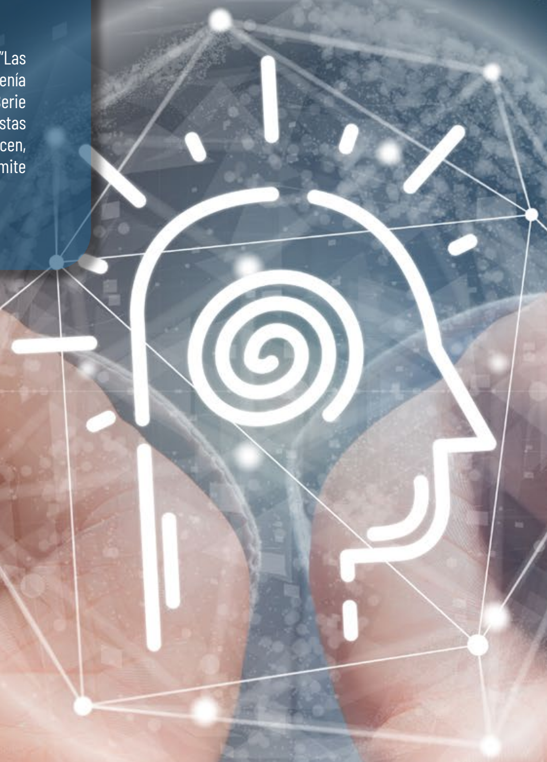
Figura 1. Conciencia

Mi experiencia en diferentes medios me ha aportado muchas herramientas para elaborar una pieza audiovisual, desde las herramientas técnicas como la locución, cursos de iluminación y dirección, audio, cursos de fotografía, la edición y la postproducción, hasta los elementos teóricos y conocimientos como la elaboración de un proyecto audiovisual, talleres de guion, de escritura, teoría del color, teoría de la composición y preparación en temas de teoría sobre derechos humanos fundamentales, etcétera. En general, te vuelves experto o tienes gran conocimiento en los temas que investigas y trabajas para un programa o documental, así que mi visión social me ha llevado a emplear la técnica como una herramienta con la que transmito mensajes y en la que creo fielmente: los documentales".