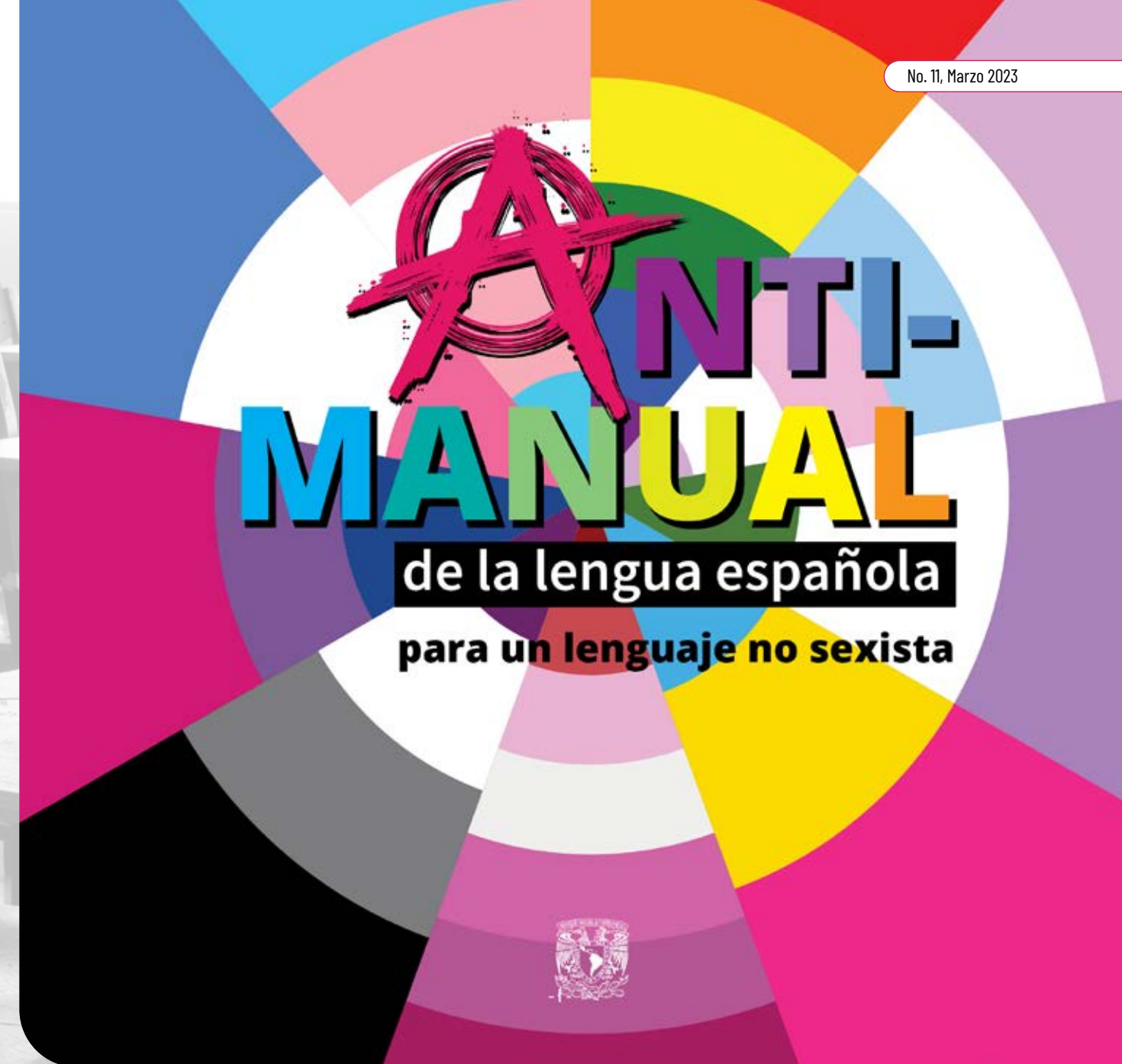
Figura 1. Antimanual de la lengua española para promover la igualdad de género.