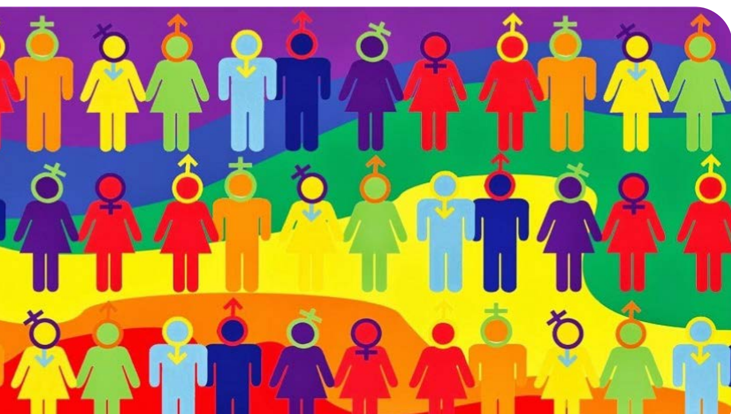
Figura 2. El antimanual parte de la idea de que las prácticas lingüísticas crean la realidad.

A continuación, retomo como un manifiesto libertario la página 8 del Antimanual que se titula Advertencia :