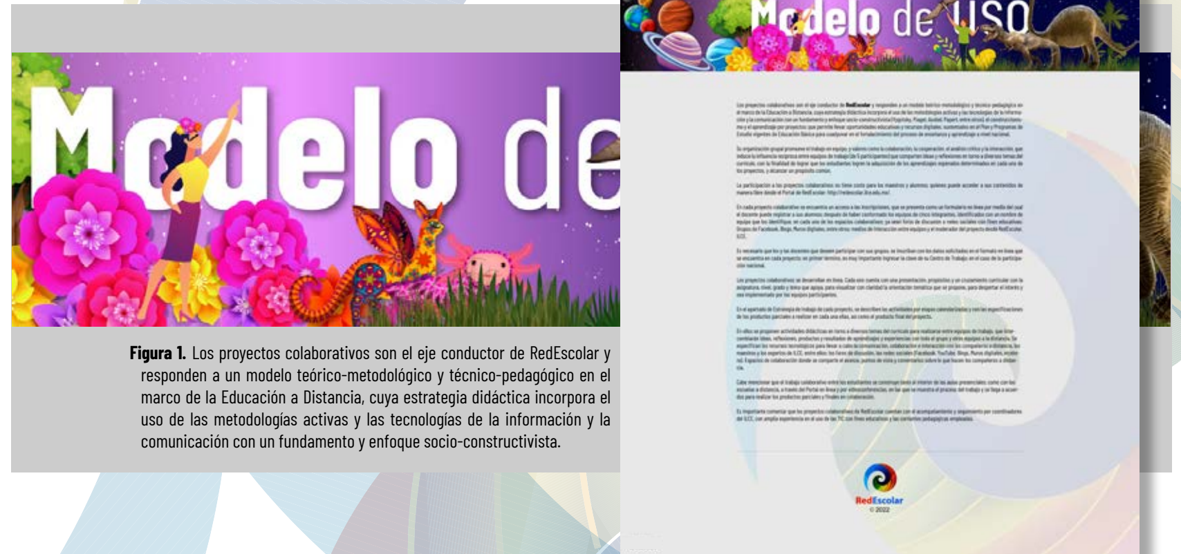
Figura 1. Los proyectos colaborativos son el eje conductor de RedEscolar y responden a un modelo teórico-metodológico y técnico-pedagógico en el marco de la Educación a Distancia, cuya estrategia didáctica incorpora el uso de las metodologías activas y las tecnologías de la información y la comunicación con un fundamento y enfoque socio-constructivista.

Los proyectos colaborativos son el eje conductor de RedEscolar, los cuales permiten brindar oportunidades educativas y recursos digitales, sustentados en el Plan y Programas de Estudio vigentes de Educación Básica en México para coadyuvar en el fortalecimiento del proceso de enseñanza y aprendizaje a nivel nacional e internacional.