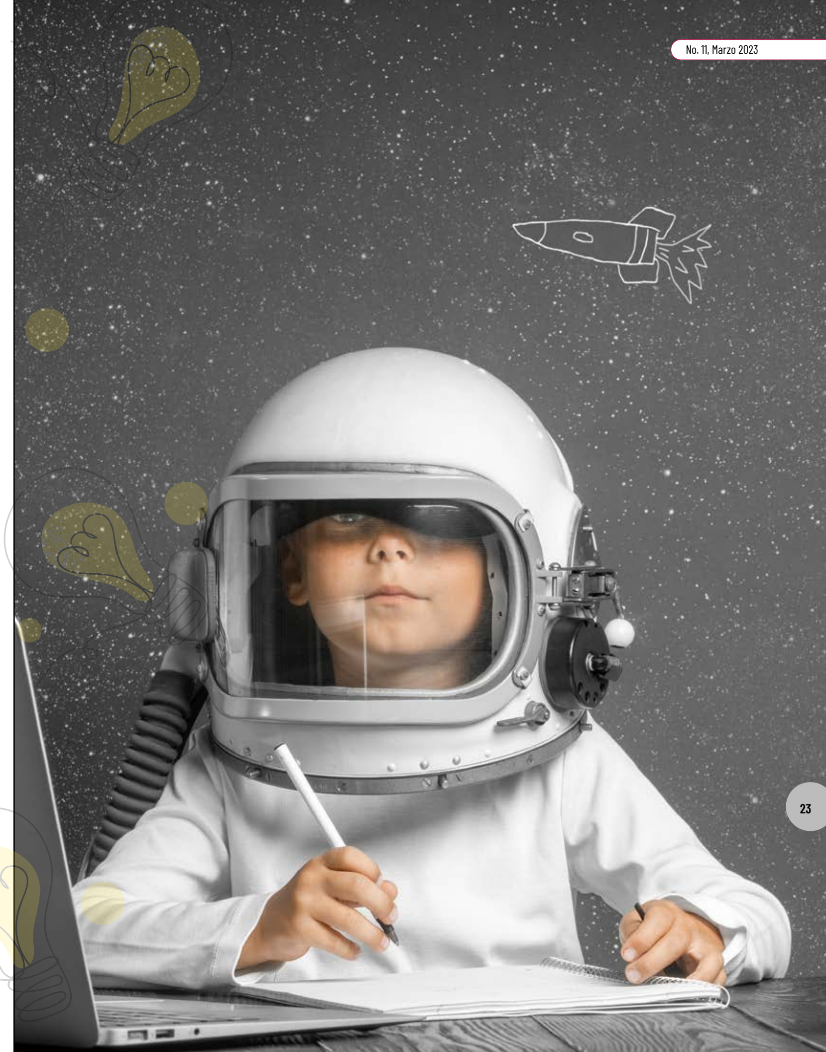
Figura 1. Es indispensable potenciar el desarrollo de personas creativas.