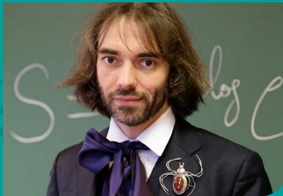
Cédric Villani. Princeton Institute for Advanced Studies.

En esta brillante charla, que se transcribe a continuación, el afamado y reconocido Matemático francés Cédric Villani (medalla Fields) nos muestra por qué hacer matemáticas resulta tan atractivo y necesario en estos tiempos sumergidos en los datos y sistemas globales. La imaginación y la resolución de problemas sofisticados puede ser tan emocionante y placentera como muchos de los goces convencionales de la vida. Compartido bajo licencia Creative Commons. Todos los derechos Ted Talks. Consulte el video en https://www.ted.com/talks/cedric_villani_what_s_so_sexy_about_math/