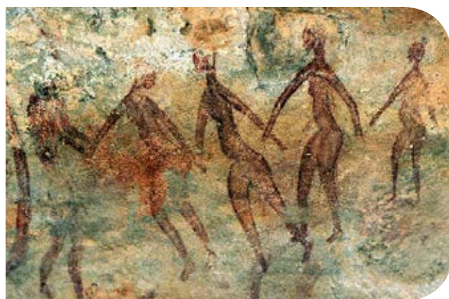
Figura 2. Pinturas rupestres sobre cacerías y bailes en torno al fuego.