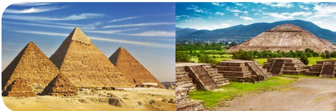
Figura 6. Las pirámides de Egipto y Teotihuacán.

El lenguaje es la herramienta fundamental del desarrollo, pues permite ampliar la comprensión y brinda estructura al pensamiento. Hablar de acciones y objetos específicos, propiciaba recordar el pasado e imaginar un futuro. De este modo se erigieron obras de ingeniería que aún hoy en día nos llenan de asombro, como las pirámides egipcias y mesoamericanas.