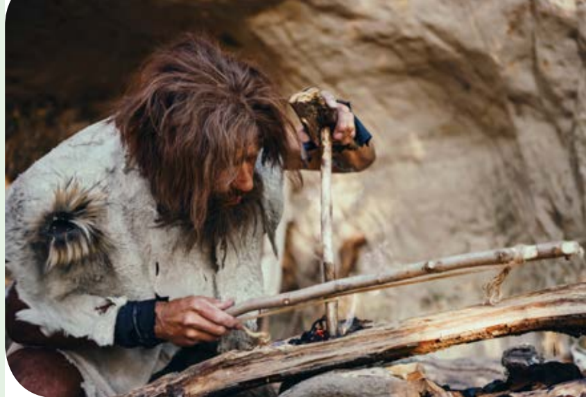
Figura 5. División del trabajo y crecimiento de los grupos humanos.

Cuando estas primeras palabras fueron utilizadas por los homínidos primitivos, y cuando ellos se percataron de la capacidad de comunicación que el lenguaje les brindaba, crearon otras palabras más para comunicar sus actividades relacionadas con la búsqueda, recolección y cocimiento de comida. Ello les ayudaba a organizarse y establecer la división de actividades, tales como juntar madera para el fuego, buscar y traer al refugio los frutos y animales necesarios para alimentarse, dando origen a la división del trabajo.