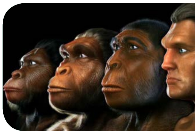
Figura 1. Individuos de algunas de las especies de los homínidos.

Tiempo después, los homínidos empezaron a distinguirse de todas las demás especies por tres comportamientos muy característicos. El primero referente a las dimensiones de su cráneo, poco mayor al de los demás antropoides (incluidos los chimpancés). El segundo es su modo de sostenerse sobre las extremidades traseras, lo que les permitió caminar y correr erguidos. El tercero es su habilidad para iniciar, controlar y utilizar el fuego con tal de guarecerse del frío, iluminar sus refugios, cocinar sus alimentos y protegerse de otros animales.