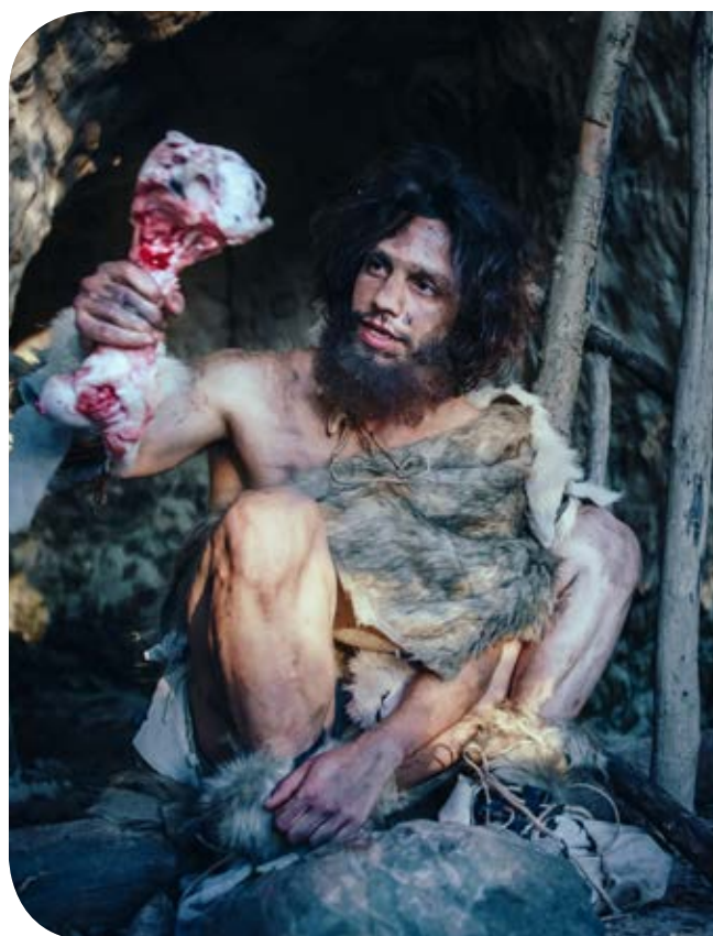
Figura 4. El cocimiento de los alimentos y la alegría de los comensales.

Ahora sabemos de la relación entre los grupos de homínidos, y la interacción entre ellos, con el tamaño de la corteza frontal. El fuego jugó un papel relevante para el cuidado de la salud. Los alimentos se consumían cocidos, con menos parásitos, facilitando una mejor digestión. Esto expandió el cerebro. Los vestigios hallados nos muestran reuniones en grupos alrededor de fogatas para comer al final de la tarde, hora aprovechada también para calentar e iluminar el refugio buscando alejar animales que pudiesen acercarse por el olor de los alimentos. Habremos de imaginarlos sentados en torno al fuego, tal como nosotros lo seguimos haciendo en las tardes y noches invernales.